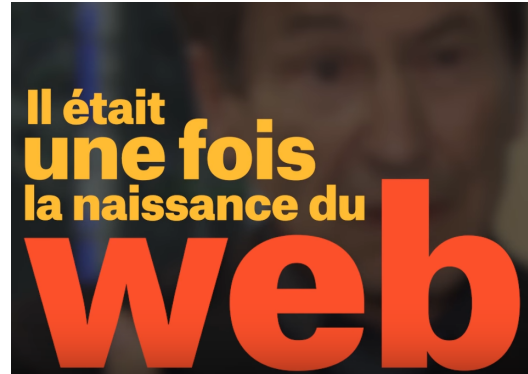
Doc 2. Il était une fois la naissance du Web RTS https://youtu.be/UwGhy_uPHY0